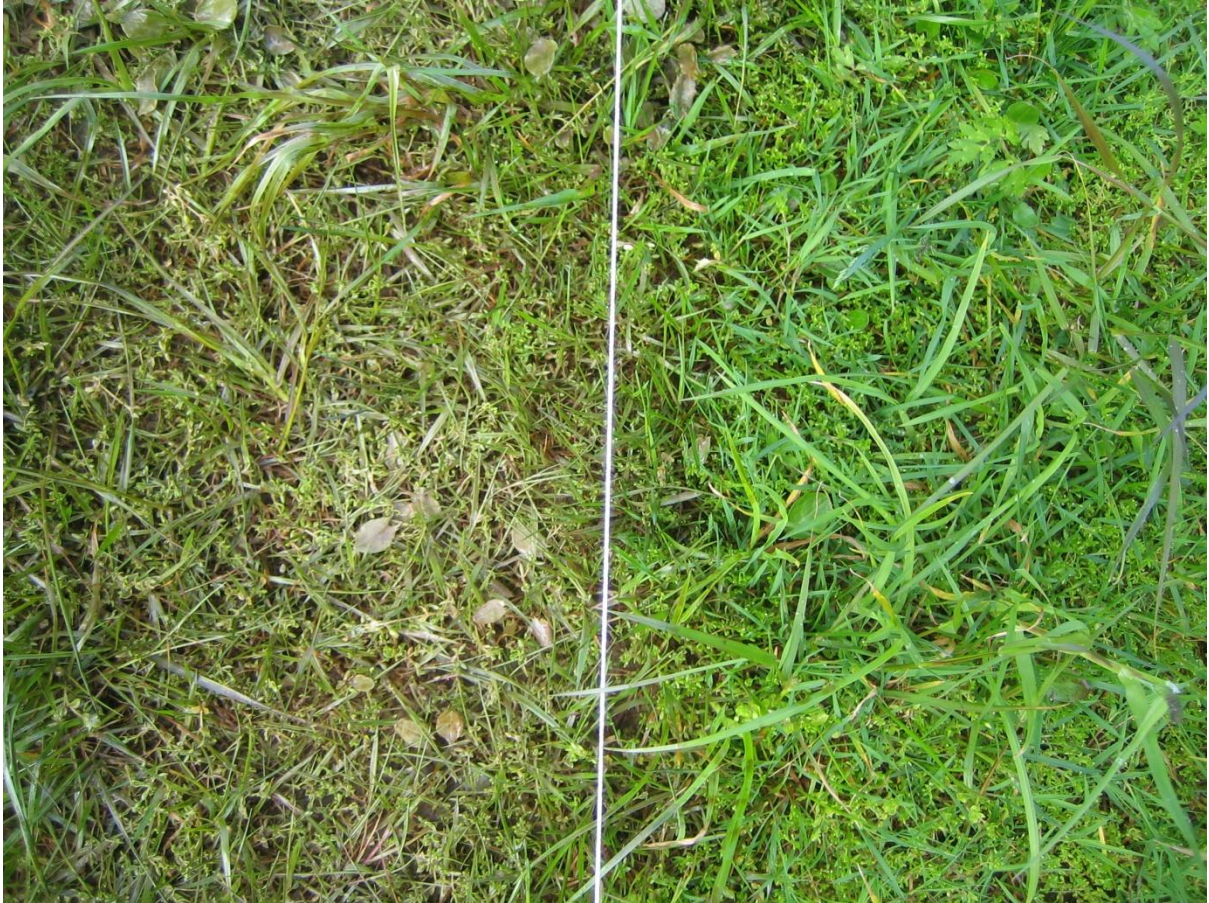
Mynd... Vinstrumegin taðað við súrløgi. Høgrumegin óviðgjørt.

Niðurstøðan av royndini er, at súrløggur svíðir grasið, men um sprænt verður meðan gróður er, er grasið komið fyri seg aftur aftaná seks vikur, eisini um súrløggurin er óblandaður. Hvørki grasúrþøkan ella grassamansetingin bleiv kannað.